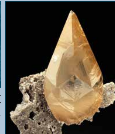
Calcite: 5,2 cm. Elmwood Mine, Tennessee. Coll. L. Gal, foto R. Appiani. Calcite: 5,2 cm. Elmwood Mine, Tennessee. Coll. L. Gal, photo R. Appiani.