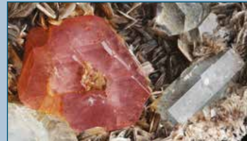
"Apatite" con acquamarina, Shigar Valley, Pakistan. Coll. L. Piasco. "Apatite" with aquamarine, Shigar Valley, Pakistan. Coll. L. Piasco.