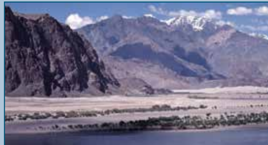
Shigar Valley, Pakistan. Paradiso per i cristalli. Shigar Valley, Pakistan. A paradise for crystals.

Also this year Bijoux Expo , successfully completed at the 17th edition, will be hosted at the same time as the Bologna Mineral Show. An unmissable opportunity to admire, give away and give to yourself an object of value and design. The offer for the visitors is rich and varied: costume jewelry in silver, turquoise, lapis lazuli and semi-precious stones with ethnic taste, so fancy nowadays, amber jewellery, Asian necklaces with ruby, emeralds and other precious stones. In addition to the splendid creations on display, it is also possible to buy semi-precious stones and gemstones to have a personalized jewel created by expert goldsmiths or by your trusted jeweler. Ample space will be dedicated to Italian goldsmith handycraft, a symbol of luxury made in Italy. Bijoux Expo, for all that is beautiful, bright and precious. Bologna Mineral Show and Bijoux Expo . Two events matched, well distinct but at a single price, for a double result of public and exhibitors.