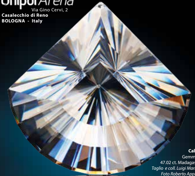
Calcite Gemma di 47.02 ct. Madagascar. Taglio e coll. Luigi Mariani.

Unipol Arena Via Gino Cervi, 2 Casalecchio di Reno BOLOGNA - Italy