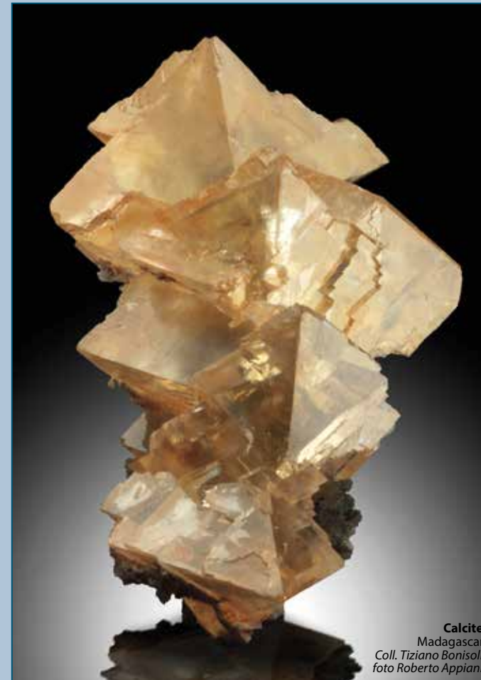
Calcite. Madagascar. Coll. Tiziano Bonisoli.

Calcite is not only one of the most common minerals in nature, but also among the most appreciated collectibles for the beauty and variety of its crystals. Calcite is not just beauty: the history of mineralogy is closely linked to the study of this mineral and its properties, starting from the first intuitions of Haüy on the structure of the crystals, ending with its peculiar optical properties, including birefringence, widely exploited in the creation of microscopes from mineralogy and beyond. At the 51st Bologna Mineral Show will be proposed an extensive review of samples of calcite from all over the world, together with an educational path that will illustrate its properties.